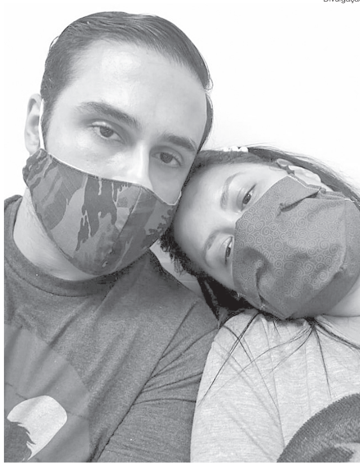
Casal já arrecadou mais de R$ 5.800,00

Quem quiser ajudar o casal nas despesas desta cirurgia cardíaca é só acessar a vakinha virtual: https://www.vakinha.com.br/vaquinha/ajuda-para-custos-de-uti-de-rosanne-rocha