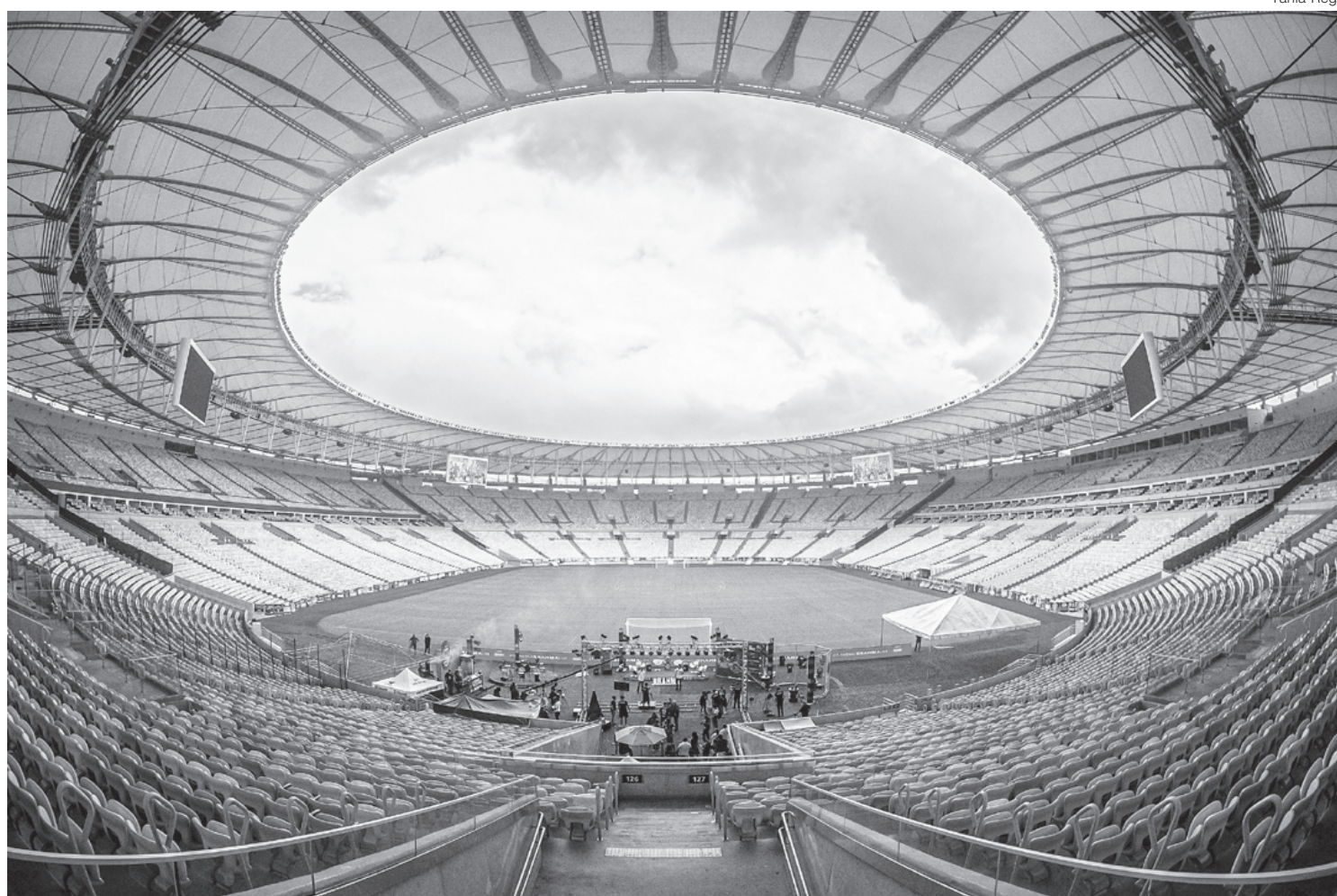
Em nota, a Alerj informou que os parlamentares concluíram que, neste momento, a Casa vai continuar centrando o trabalho no combate à covid-19

O nome oficial do Maracanã, no Rio de Janeiro, homenageia o jornalista Mário Leite Rodrigues Filho, que coordenou a campanha pela construção do estádio, no final dos anos 40. Mário Filho travou uma batalha na imprensa contra o en-