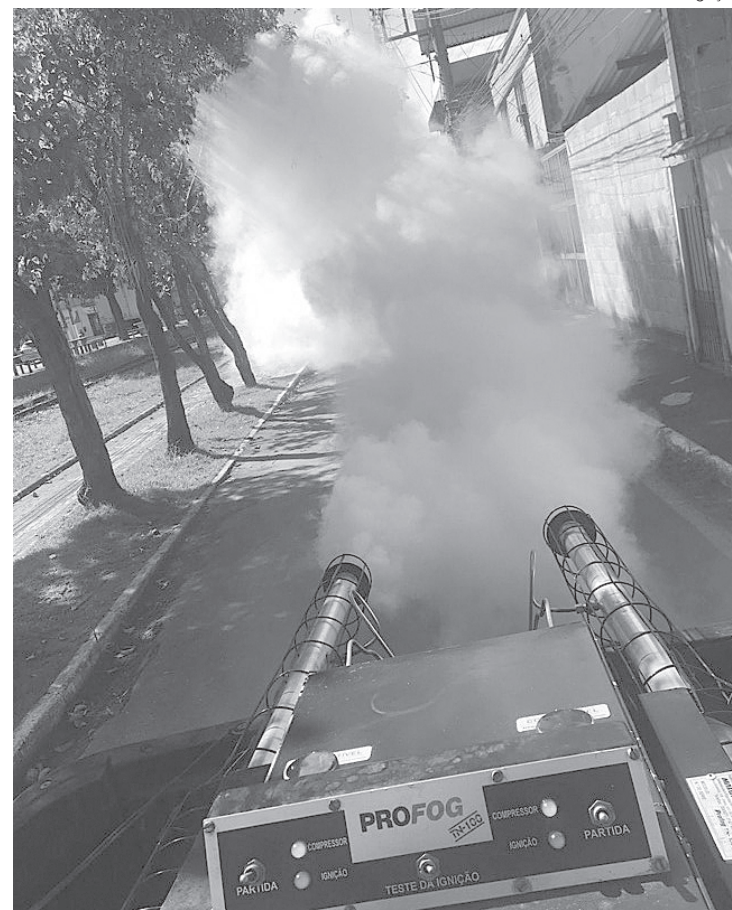
Colônia Santo Antônio receberá serviço nas próximas semanas