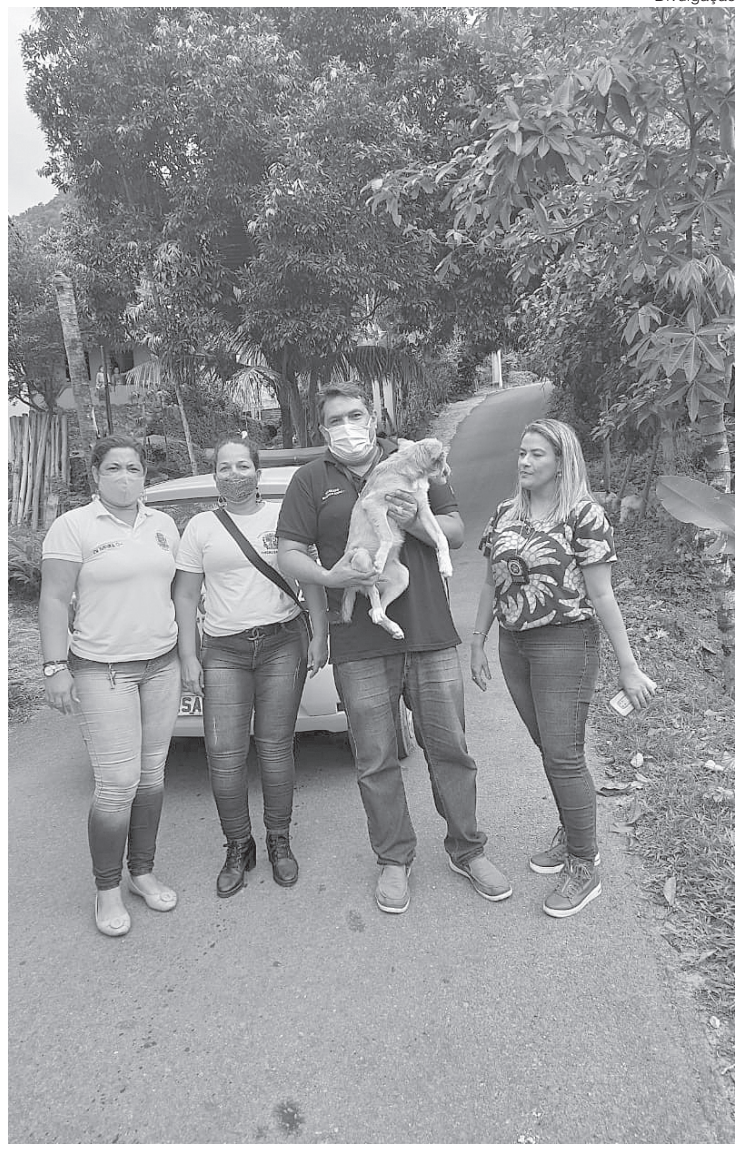
O cachorro ficava preso o dia inteiro em uma corrente curta