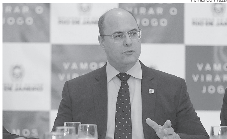
Na segunda-feira, dia 05, governador afastado teve negado o pedido de suspensão do processo de impeachment

No dia 23 de setembro de 2020, a Assembleia Legislativa do Rio de Janeiro (Alerj) aprovou - 69 votos a favor e nenhum contra - o relatório que pedia o impeachment de Witzel. A sessão reuniu 69 deputados, presencialmente ou de forma remota. Um deputado