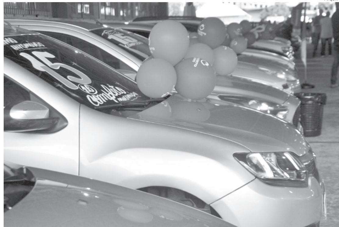
Falta de produtos afeta todos os segmentos automotivos, diz Fenabrave

Segundo a Fenabrave, todos os segmentos automotivos continuam sofrendo com problemas de abastecimento de produtos pela indústria, afetada pela falta de peças e componentes e