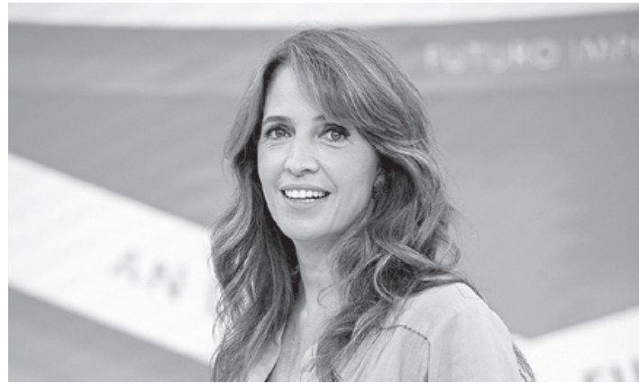
Poliana Abritta, apresentadora do 'Fantástico'