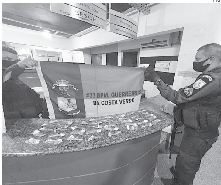
Material apreendido foi entregue na 166ª DP