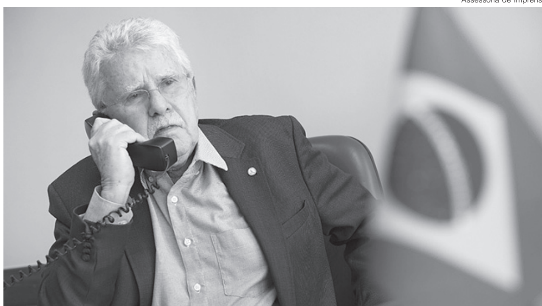
Luiz Antônio entra para frente que defende ampla vacinação no Brasil

O deputado Luiz Antônio também destacou que falta um diálogo mais direto dos representantes públicos com a população. “É importante sermos francos, não criar expectativas fora da realidade. Não é fácil convencer as pessoas que pegam transportes cheios de segunda a sexta que, no final de semana, não podem encontrar a família, ir à igreja ou se reunir com os amigos”, finalizou.