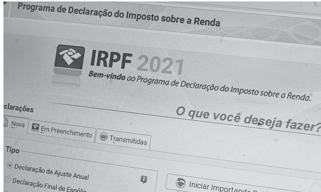
De acordo com o projeto, o último dia para apresentar a declaração passa de 30 de abril para 31 de julho

De acordo com o projeto, não há mudança no cronograma do pagamento da restituição. Assim, o primeiro lote deve ser liberado em 31 de maio de 2021. De acordo com o relator da matéria no Senado, senador Plínio Valério (PSDB-AM), o que se pretende é dar tempo para os contribuintes conseguirem os documentos necessários à declaração, em um cenário de pandemia, onde os estabelecimentos não têm funci-