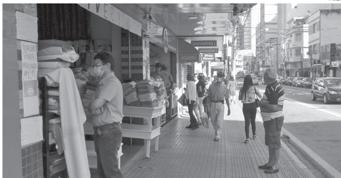
Objetivo é dar condições para que o comércio continue funcionando de forma segura

– Nós continuamos firmes nas fiscalizações, trabalhando para manter o comércio aberto. No último fim de semana, mais quatro estabelecimentos foram fechados por descumprirem os decretos do município. A maioria das pessoas que está circulando pelas ruas, não está realizando compras. Elas estão com outros afazeres e infelizmente o comércio é que está sendo penalizado – explicou.