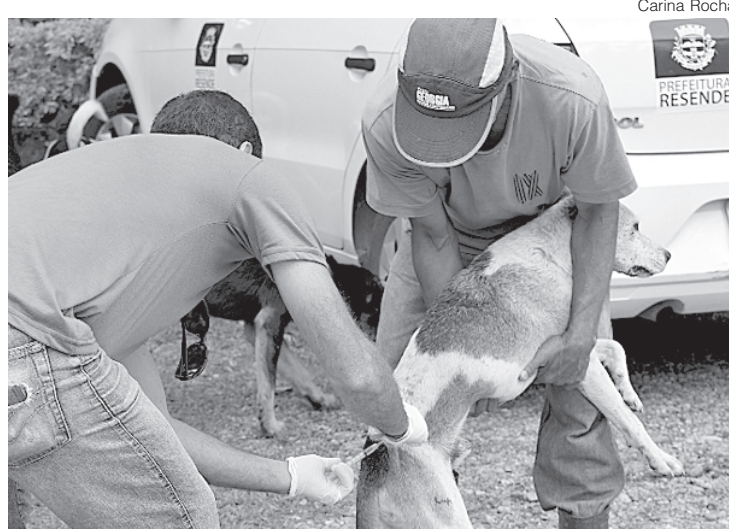
Primeira etapa será na zona urbana nos meses de abril e maio