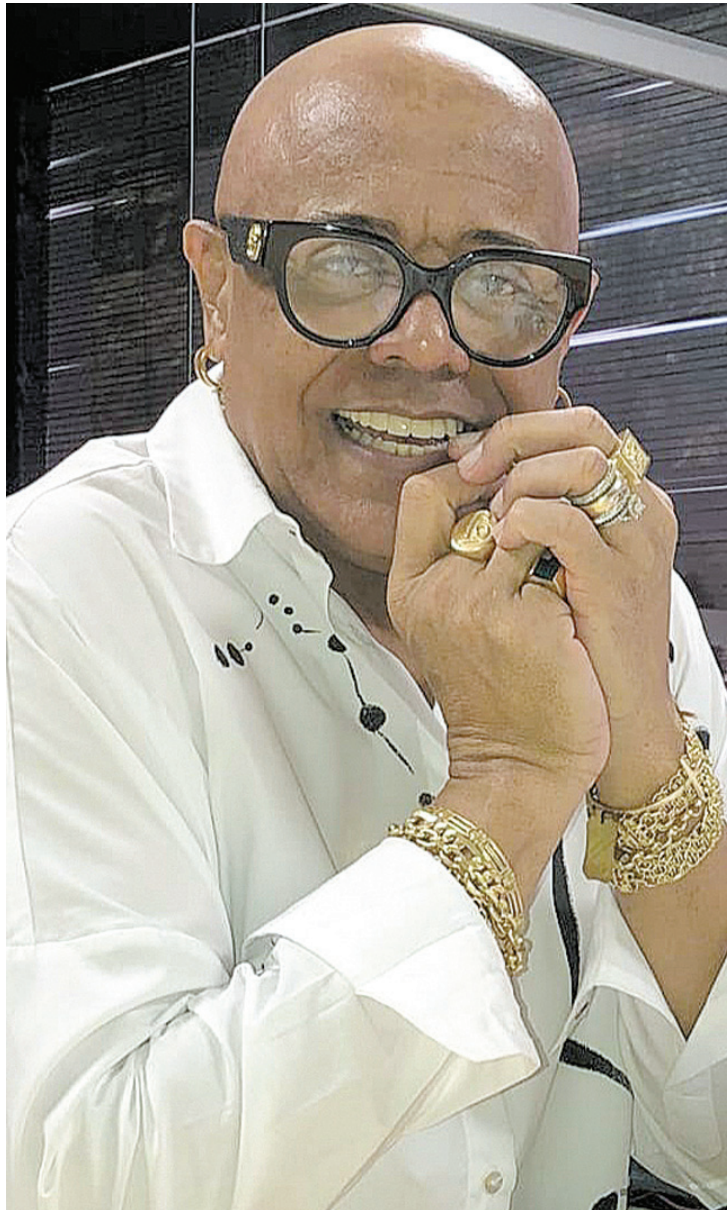
O apresentador da Band, Taí Braz, festeja seus 13 anos do Taí Para Todos