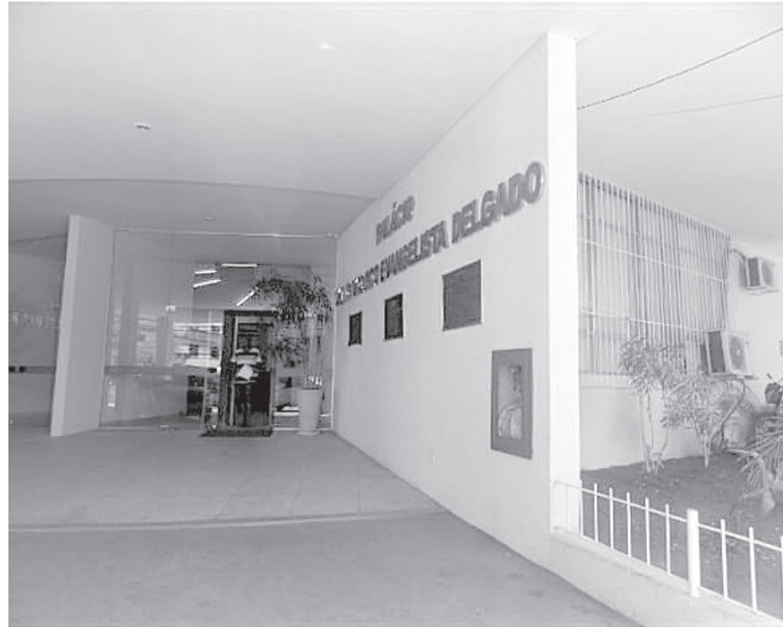
Para lembrar campanha contra maus tratos a animais, fachada da Câmara será iluminada em laranja

Neném segue visitando diversos lugares e acompanhando os avanços da vacina em Volta Redonda, “vale lembrar que devemos usar máscara, lavar sempre as mãos e passar álcool gel, e o mais importante evitar aglomeração. Na Câmara continuamos atentos às determinações, e ainda adotei um processo de sanitização semanal para proteger os