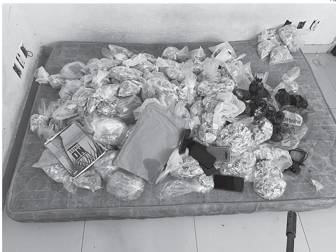
Agentes encontraram no local maconha, cocaína e fracos de cheirinho da loló

Os suspeitos foram levados para a Delegacia de