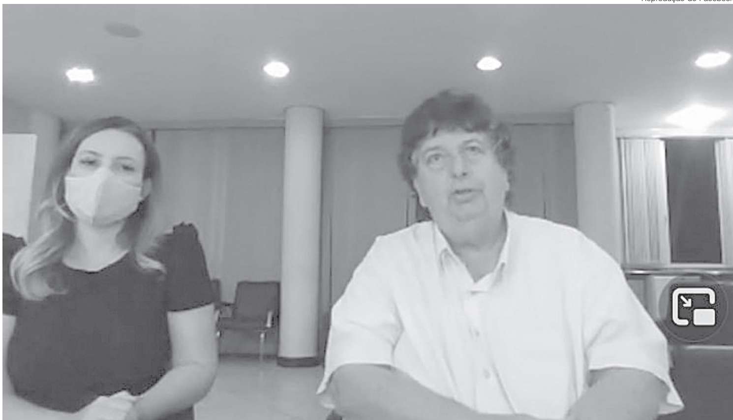
Neto afirmou que vai recorrer da decisão que mandou fechar o comércio